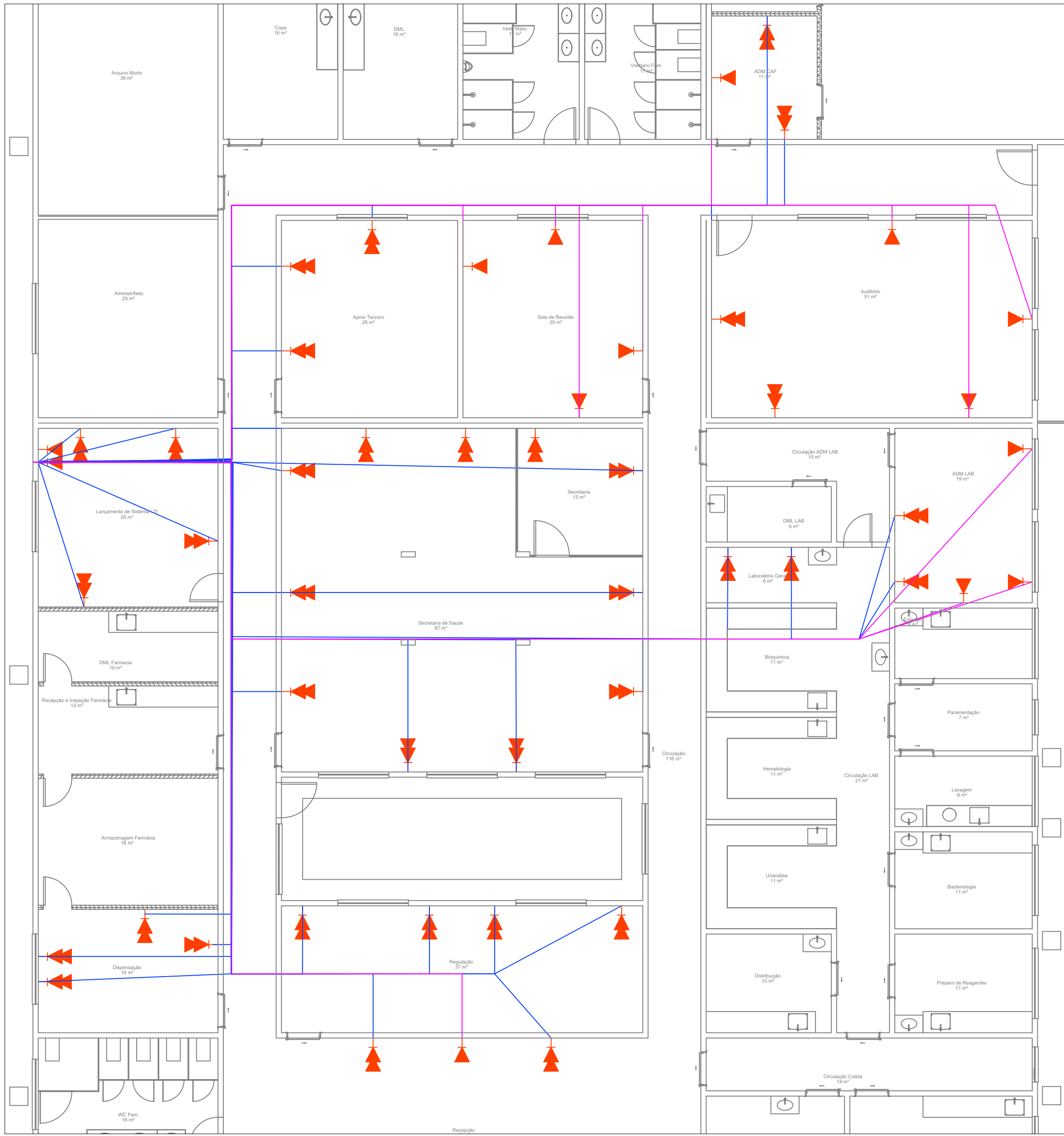
Pontos de Rede Escala: 1:1500